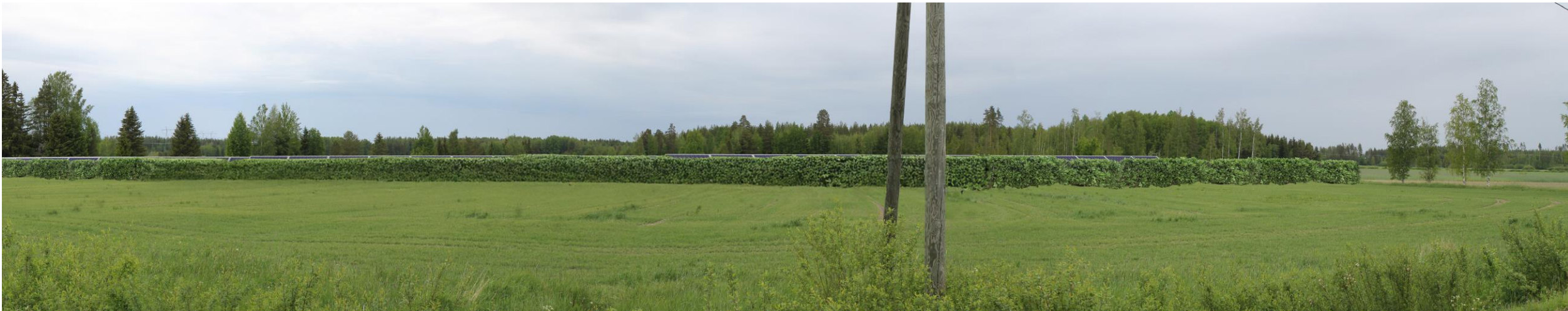
Metsäkulmantie. Paneelien edessä maisemointityyppi B.