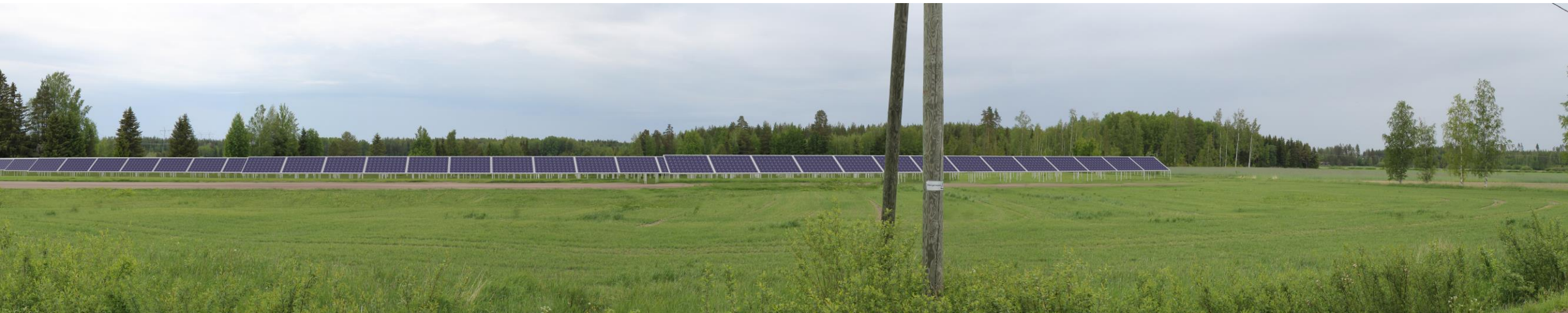
Metsäkulmantie. Suuntaa antava tyypikuva, jossa voimalat sijoitettu 50 m katseluetäisyydelle.