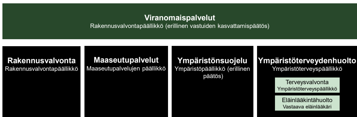
Kuva 2 Ehdotettu organisaatio