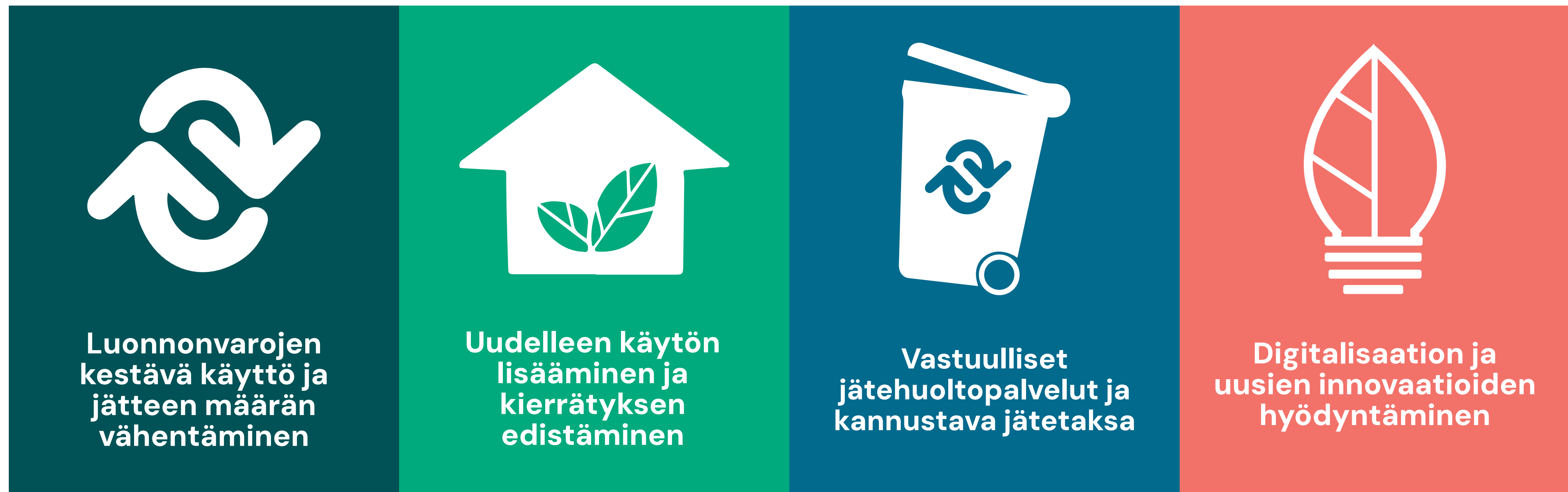
Kuva 3. Jätepoliittisen ohjelman visio ja tavoitteet.

Jätepoliittisen ohjelman tavoitteet vuosille 2025-2030 ovat seuraavat: