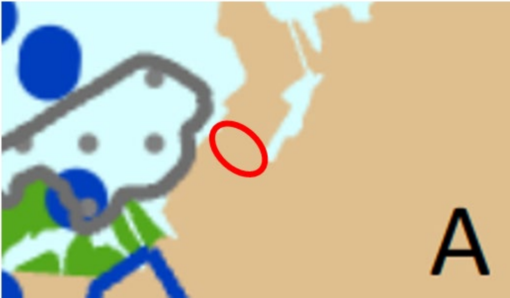
Kuva 4. Kaavaote maakuntakaavasta. Suunnittelualueen likimääräinen sijainti on merkitty punaisella ympyrällä.

Maakuntakaavassa 2040 asemakaavoitettavaan alueeseen kohdistuu merkintä taajamatoimintojen alueesta (A).