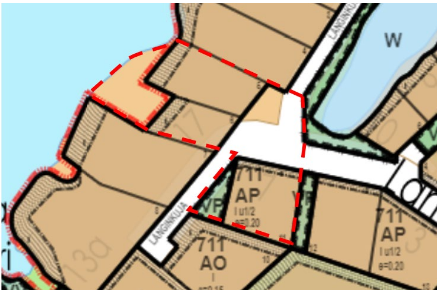
Kuva 7. Ote ajantasakaavasta. Suunnittelualue merkitty punaisella katkoviivalla.

Ranta-alue suunnittelualueen kohdalla on osin asemakaavatonta aluetta. Muu alue on asemakaavoitettu vuonna 2002 (Ak 909/92). Asemakaavassa on erillispientalojen korttelialuetta (AO), asuinpientalojen korttelialuetta (AP), vähäinen puistokaista (VP) ja Långinkujan katualuetta.