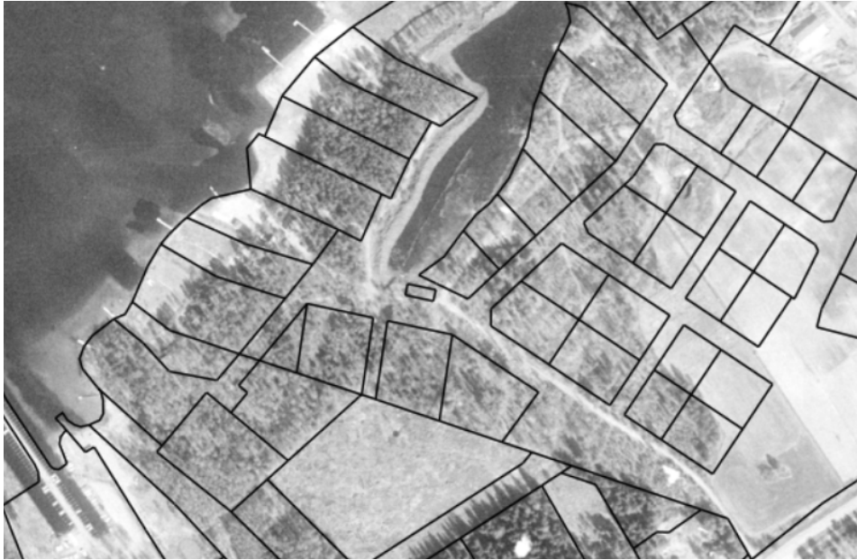
Kuva 2. Ilmakuva alueesta vuodelta 1998. Ajantasaiset kiinteistörajat.

Alueelle on rakennettu Kouvolan Vesi Oy:n vesihuoltoverkostot ja kaavan katualueella on jätevesipumppaamo. KSS Verkko Oy:n sähköverkko on toteutettu maakaapeleina. Pääosa alueella olevista datakaapeleista on Telia Oyj:n omistuksessa. Suunnittelualueella on KSS Lämpö Oy:n maakaasuverkostoa.