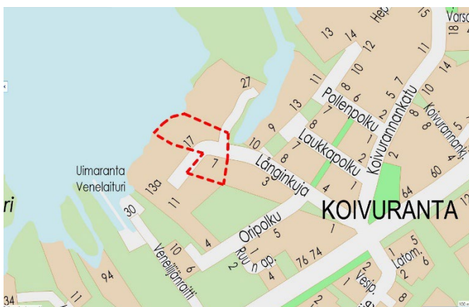
Kuva 1. Kaava-alueen sijainti rajattuna punaisella katkoviivalla.

Suunnittelualue sijaitsee Valkealan Koivurannan asuinalueella. Alueen pinta-ala on noin 1 ha.