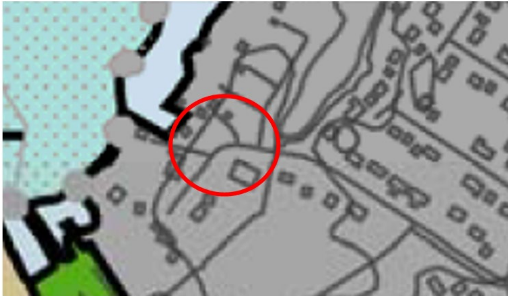
Kuva 6. Kaavaote Kouvolan keskeisen kaupunkialueen osayleiskaavasta. Suunnittelualueen likimääräinen sijainti on merkitty punaisella ympyrällä.

Alue kuuluu 6.1.2016 voimaan tulleeseen oikeusvaikutteiseen Kouvolan keskeisen kaupunkialueen osayleiskaavaan. Alue on osoitettu taajamatoimintojen alueeksi osayleiskaavassa.