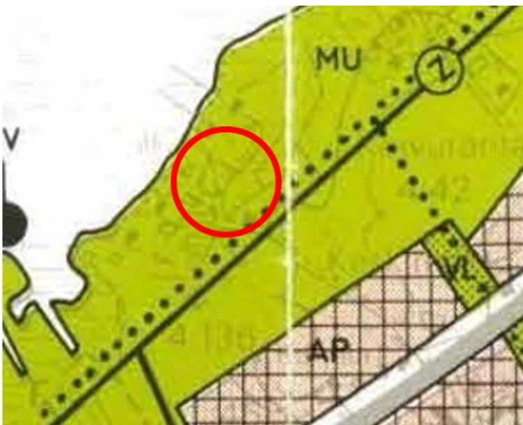
Kuva 5. Kaavaote Kirkonkylän-Jokelan osayleiskaavasta. Suunnittelualueen likimääräinen sijainti on merkitty punaisella ympyrällä.

Valkealan kunnanvaltuuston 1984 hyväksymässä oikeusvaikutuksettomassa osayleiskaavassa Koivurannan alue oli merkitty pääosin pientalovaltaiseksi asuntoalueeksi (AP), ranta-alue oli maa- ja metsätalousvaltaista aluetta, jolla on ulkoilun ohjaamistarvetta ja ympäristöarvoja (MU).