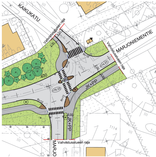
Kuva 2. Ote Kasarminkadun, Kaikukadun ja Marjoniementien liittymän katusuunnitelmasta suunnitteluvaiheen kohdalta.

Lisäksi selvityksessä on ehdotettu osin vaihtoehtoisia toimenpiteitä liikenneturvallisuuden parantamiseksi: