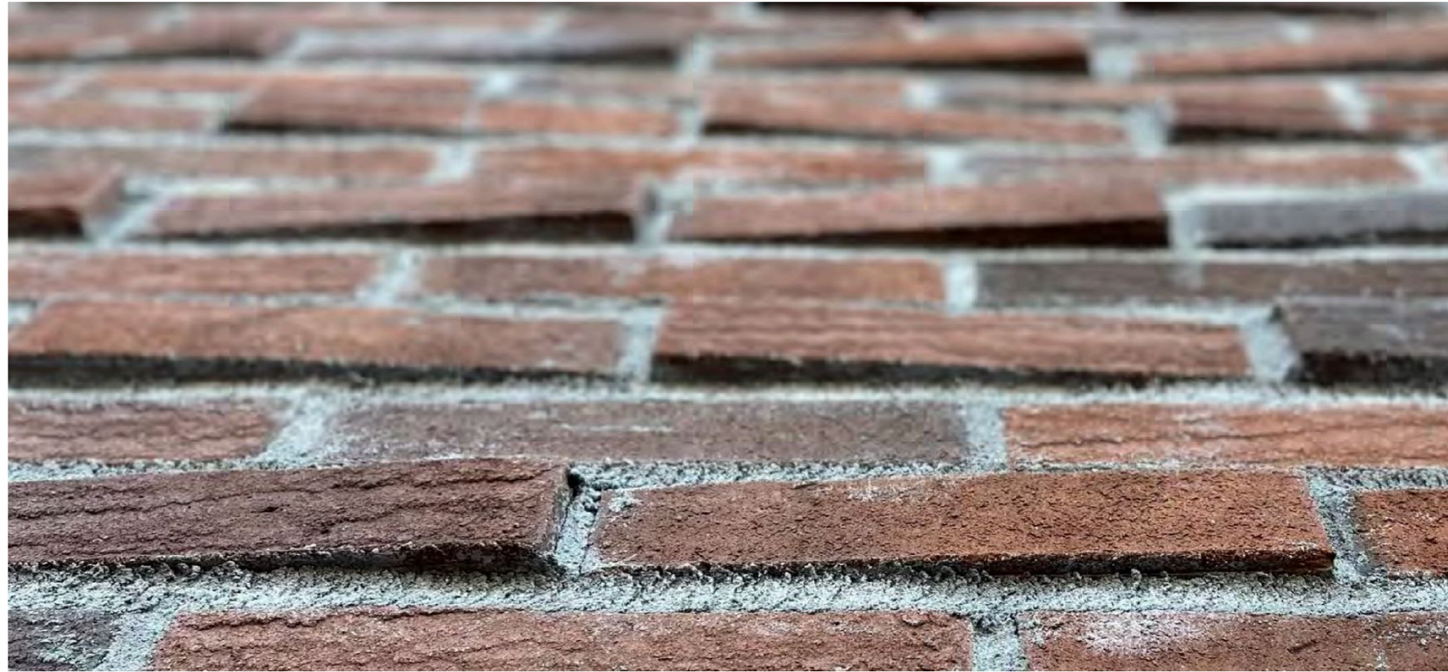
Periaatekuva vastaavanlaisesta vinomuurauksesta

Koillisjulkisivulla vinomuurataan 160 kpl + 160 kpl julkisivutililtä 3 astetta vinoon kuvissa esitetyllä tavalla.