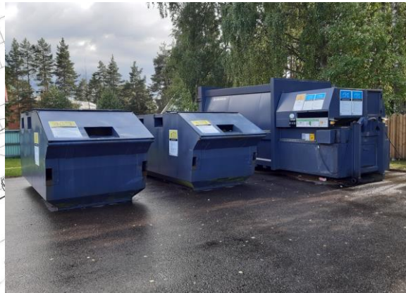
Kuva 3. Valokuva lisätyistä konteista

Kuvassa 4 on esitetty kierrätyspisteen konttien kokonaistilanne, lisätyt 3 konttia näkyvät kauimpana. Yleisilmeeltään alue oli käynnin aikana siisti, erityistä ros- kaantumista ei konttien vieressä näkynyt.