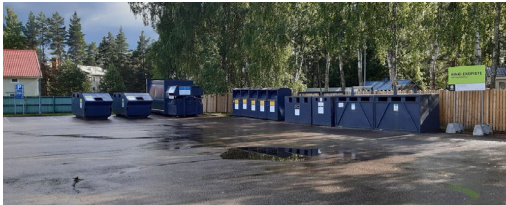
Kuva 4. Kierrätyspisteen yleisnäkymä 2.8.2022

Kuvassa 4 on esitetty kierrätyspisteen konttien kokonaistilanne, lisätyt 3 konttia näkyvät kauimpana. Yleisilmeeltään alue oli käynnin aikana siisti, erityistä ros- kaantumista ei konttien vieressä näkynyt.