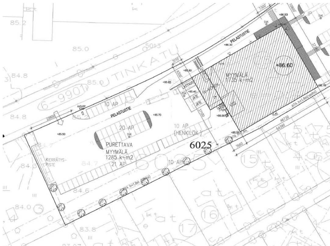
Kuva 1. Vaihtoasemapiirustus 21.9.2012

Kierrätyspiste sijaitsee kiinteistöllä 286-6-6025-25, päivittäistavarakaupan pysäköintialueen länsireunassa. Alueen asemakaavamerkintä on AL liikerakennusten korttelialue. Liikerakennukselle on myönnetty rakennuslupa 286-2008-182 ja liikerakennusta on siirretty 7,5 m rakennusaikaisella muutosluvalla 286-2008-265. Näissä luvissa kierrätyspistettä ei ole esitetty. Sen sijaan kierrätyspiste on esitetty lupaan liittyvässä vaihtoasemapiirustuksessa, jonka rakennusvalvonnasta [REDACTED] on hyväksynyt suostumuksellaan 21.9.2012 osittaisen loppukatselmuksen yhteydessä. Rakennusvalvontaviranomaisella on maankäyttö- ja rakennuslain (MRL) 153 e § perusteella ollut oikeus antaa suostumus poiketa alkuperäisestä suunnitelmasta. Vaihtoasemapiirustuksessa kierrätyspiste on esitetty tekstinä, sijoittuen aivan kiinteistön länsirajan tuntumaan sisäänajovyölyän viereen. Vaihtoasemapiirustus on esitetty kuvassa 1.